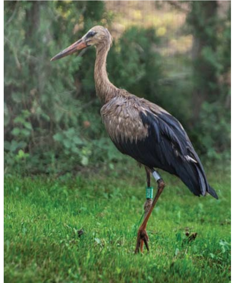
Baltasis gandras dėl numanomoms žmonių veiklos tapo „juodoju“.