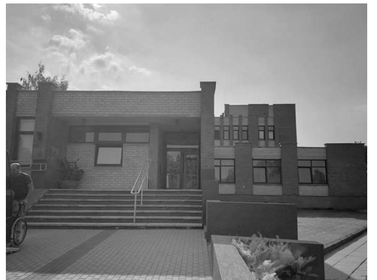
Naujasis Psichiatrijos dienos centras bus steigiamas šalia Psichikos sveikatos centro.

Dėl psichiatrijos dienos stacionaro paslaugų bus siunčiami žmonės, esant diagnozuotam psichikos ir elgesio sutrikimui ir esant bent vienai iš šių sąlygų: psichikos būklė negerėja arba blogėja ir reikalingas didesnio intensyvumo gydymas ir stebėjimas nei ambulatorinis gydymas; būtina stacionarinį gydymą palaipsniui pakeisti ambulatoriniu, reikalingas tęstinis kompleksinis psichiatrinis gydymas ir readaptacija po gydymo psichiatrijos stacionare; asmens socialinė adaptacija (darbe, šeimoje ar visuomenėje) iš dalies sutrikusi, bet asmuo išlieka pakankamai socialiai adaptuotas ir motyvuotas gydyti, kad galėtų pilnavertiškai dalyvauti Psichiatrijos dienos stacionaro gydyme.