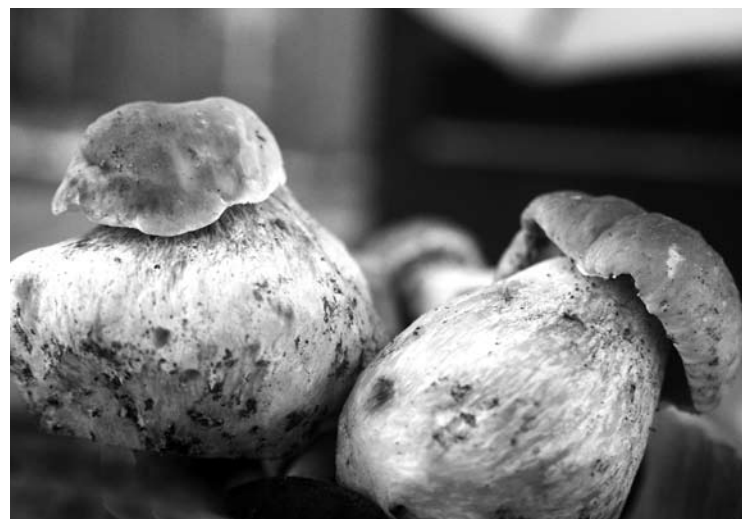
Grybaujant grybus reikia nupjauti, o ne rauti – taip miške lieka daugiau grybienos.