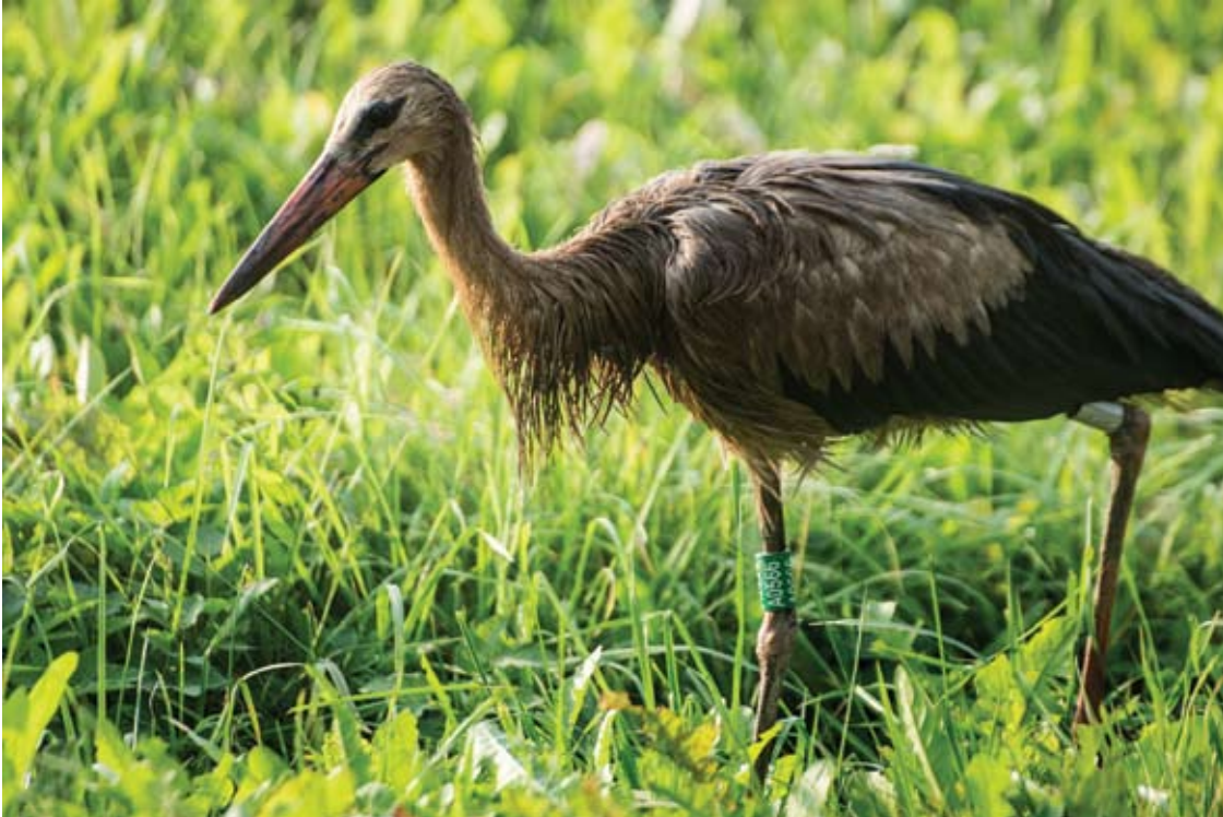
Nekreipdamas dėmesio į keliu lekiančius automobilius, gandras gaudė varles.

Antradienį, rugsėjo 12 dieną, prie Rubikių pastebėtas Ventės rago (Šilutės raj.) vasaros pabaigoje žieduotas baltasis gandras buvo panašus į juodąjį. Jis visas išsitemęs kažkokiais riebalais ar dažais. Iki Rubikių ežero iš Ventės rago 258 kilometrus sukurusiam gandrui ornitologai pranašauja niūrią ateitį.