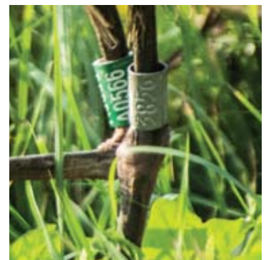
Ant gandro kojų – po žiedą.