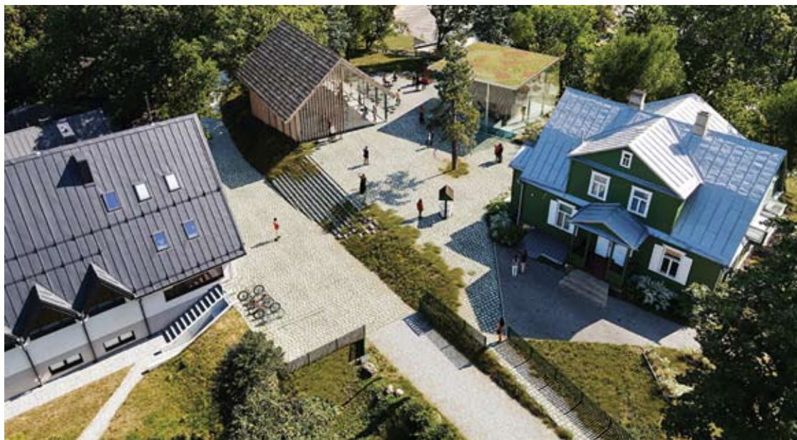
Muziejinės kalvos modernizavimo projektų konkursą laimėjo mažosios bendrijos „Fragment architektai“ projektas „Sodyba“.

Robertas ALEKSIEJŪNAS robertas.a@anyksta.lt